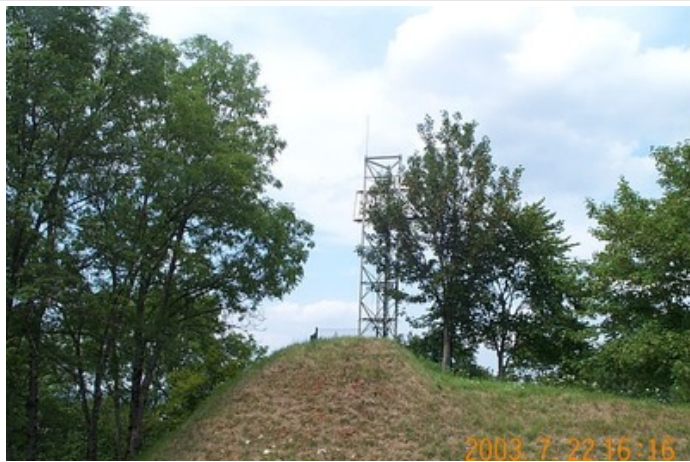
Azimut de la prise de vue : 20 gr

No du Site 25056A Site du Réseau de détail