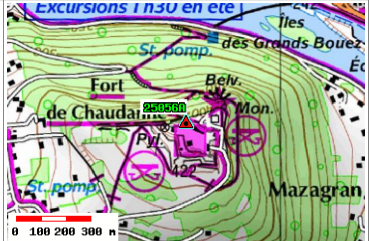
Carte : 3323 BESANCON