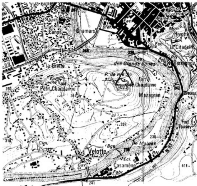
0 1 km